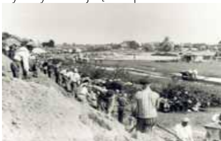
Więźniowie pracujący na skarpie przy Neuengammer Hausdeich.

Więźniowie zatrudnieni byli w zakładach SS, które z ich pracy ciągnęły finansowe profity. W kwietniu 1938 roku SS założyło zakłady »Deutsche Erd- und Steinwerke GmbH« (DESt). Przedsiębiorstwo to zakupiło nieczynną cegielnię w Neuengamme. W grudniu 1938 roku zatrudniono tu pierwszych więźniów z Sachsenhausen. Więźniowie obozu koncentracyjnego w Neuengamme musieli wykonywać najcięższe prace.