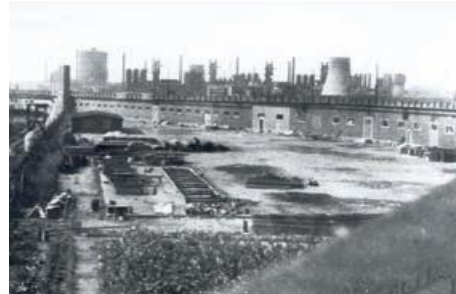
Zakłady »Hermann Göring« w Salzgitter, 1944, podobóz Drütte

obszarze północno-zachodnich Niemiec utworzono ponad 85 filii KZ Neuengamme, poza Hamburgiem były to Brema, Hanower, Salzgitter, Hildesheim i Porta Westfalica.