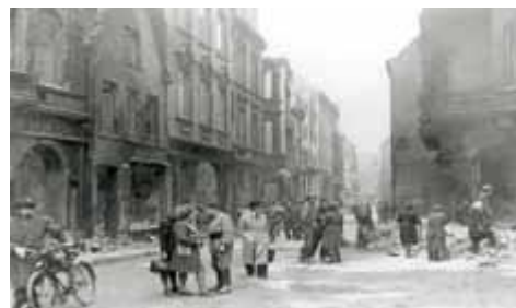
Komando porządkowe więźniarek podobozu Bremen-Obernheide

W drugiej połowie wojny w ponad 60 podobozach KZ Neuengamme zatrudniano dziesiątki tysięcy więźniów z okupowanych krajów. Pracowali oni przy produkcji zbrojeniowej, budowali bunkry, obiekty przemysłowe i podziemne hale produkcyjne, ustawiali zapory przeciwczołgowe, a także byli wysyłani do odgruzowywania i naprawy dróg komunikacyjnych. W 24 filiach kobiecych, należących w roku 1944/45 do obozu macierzystego Neuengamme, więźniarki pracowały w naziemnych i podziemnych zakładach zbrojeniowych oraz przy odgruzowywaniu i budowie zastępczych domów mieszkalnych. Pochodziły one ze Związku Radzieckiego, Czechosłowacji, Węgier, Polski, Słowenii, Francji, Belgii, Holandii i Niemiec.